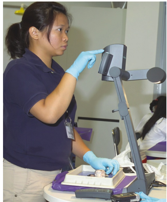
Das Zoomrad wird verwendet, um bestimmte Objekte zu vergrößern.

Der 9-Bild Speicher ermöglicht es, jedes Experiment Schritt für Schritt zu speichern und die Bilder später mit nur einem Knopfdruck wieder aufzurufen.