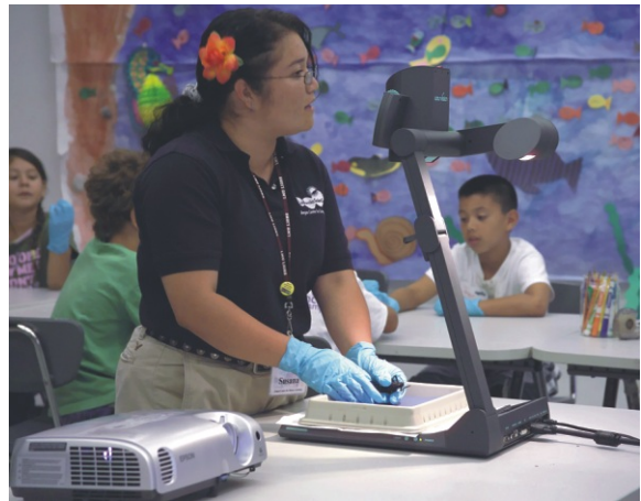
Die Kinder haben einen Riesenspaß beim Durchführen eines interaktiven Experiments (Bild unten). Es wird Ihnen von ihrer Lehrerin mit Hilfe des Visualizers auf einem großen Bildschirm gezeigt (Bild oben).

Eine der größten Hürden der wissenschaftlichen Ausbildung ist die Unsicherheit im Unterrichten der Wissenschaft, die viele Lehrer haben. Sie wissen nicht, wie sie auf interessante Weise interaktive wissenschaftliche Experimente in ihren Unterricht einbauen sollen. Viele Lehrer haben noch nie gesehen, dass interaktive Experimente gezeigt wurden, geschweige denn selbst welche vorgeführt. Der WolfVision Visualizer zeigt ihnen, wie interaktives wissenschaftliches Unterrichten und Lernen möglich ist.