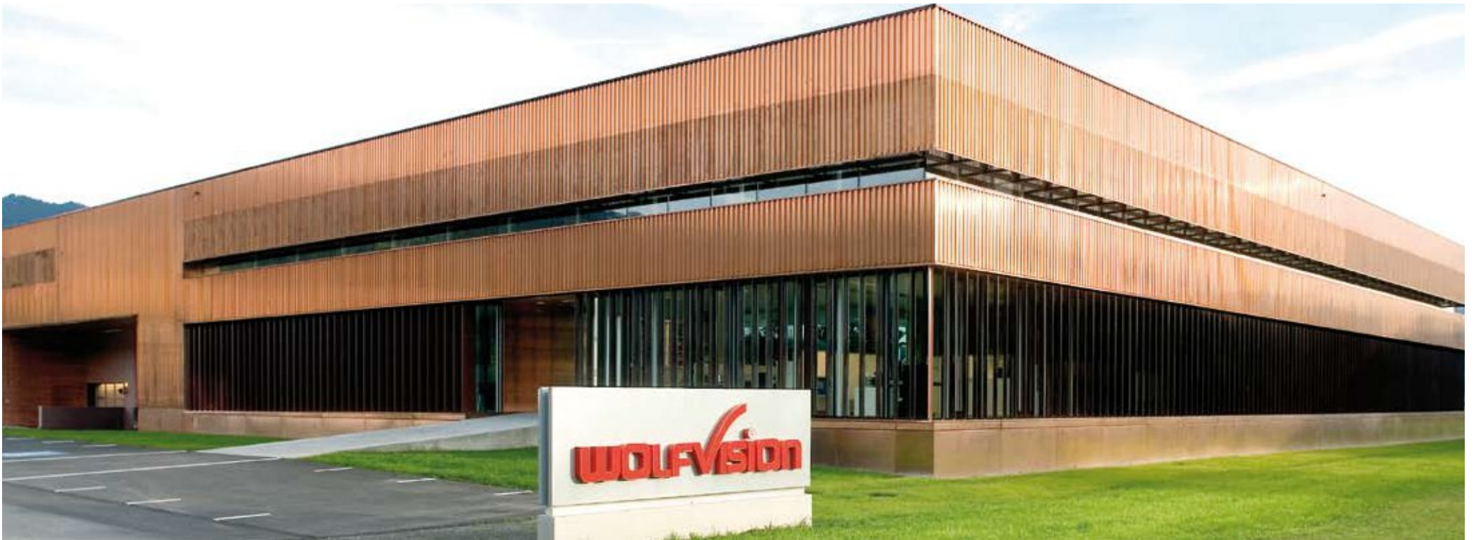
Im Jahr 2008 zog WolfVision nach Klaus in das neue Firmengebäude. Die einzigartige Architektur wurde im letzten Jahr mit dem „BTV Bauherrenpreis“ prämiert.